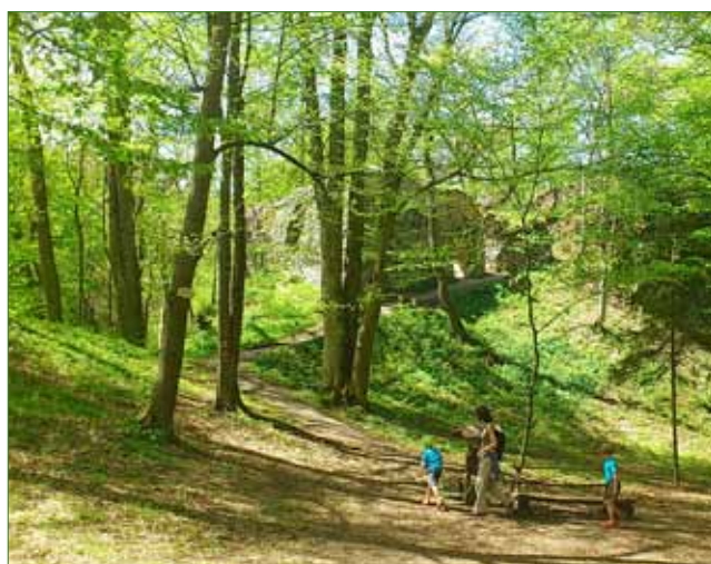
►►► Jednou z nejcennějších lokalit Křivoklátska je údolí Vůznice mezi Nižborem a hradem Jenčov.

UNESCO, ptačí oblastí evropské soustavy Natura 2000 a v nejcennějších částech je též chráněno soustavou maloplošných chráněných území. Další zvýšení ochrany je tudíž podle nás zcela nadbytečné,“ řekl Řihák.