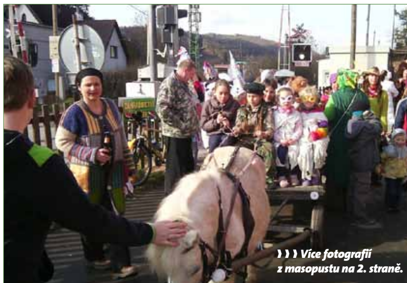
))) Více fotografií z masopustu na 2. straně.

Maškary, v zastoupení Principála, převzaly klíč od obce a pokračovaly na frekventovaný Novohutský most, kde obveselovaly projíždějící auta. Dále se pokračovalo do Říma. Zpívalo se, tančilo, pilo a jedlo. Průvod završily výborné zabijačkové hody v restauraci Keltovna, ale veselice pokračovala dále v podání našich nejmenších, pro které si připravila krásný program pí Krátká s dcerou. Děkujeme všem za krásně prožité dopoledne s krásným počasím a dobrou náladou.