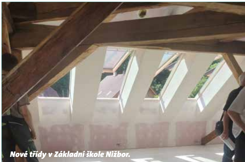
Nové třídy v Základní škole Nižbor.