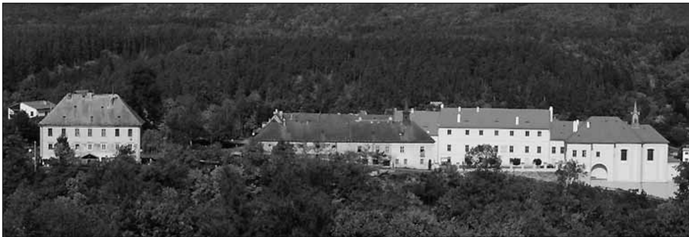
Rekonstrukce nižborského zámku je jednou z priorit vedení obce a mělo by tomu tak být i v budoucnu.