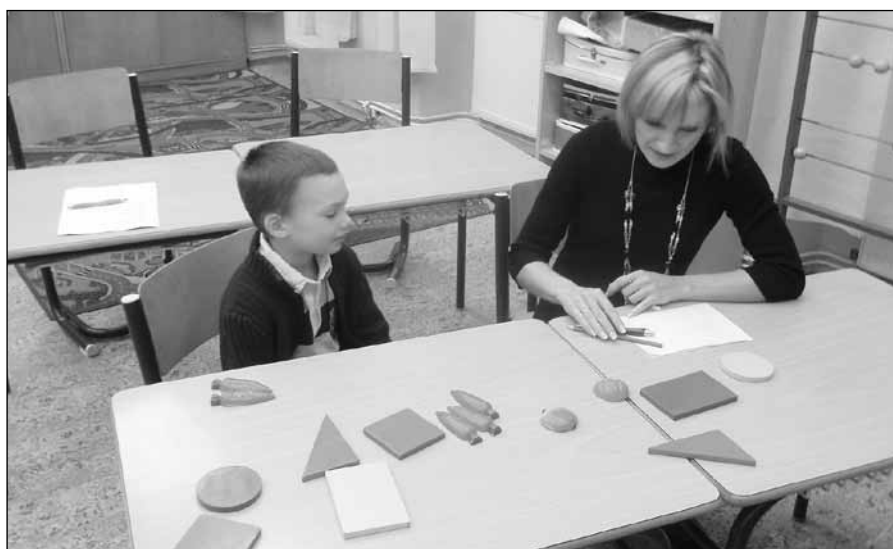
V pátek 5. února proběhl zápis do 1. třídy nižborské Základní školy.

V 16 hod. v Nižboru před ZŠ Nižbor, v 17 hod. ve Žloutkovicích před obchodem, ve Stradonicích na návsi v 17:30 hod.